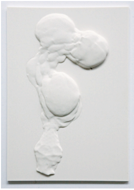
Elisabeth Eberle Relief Material: Corian, gefräst Format: 14,8 x 21,0 cm