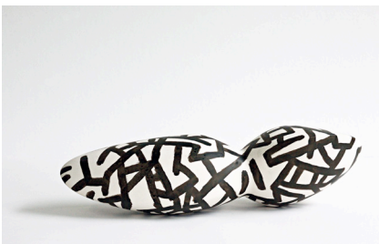
Kuros Nekouian Guss, bemalt Material: Polymergips, Pigment Format: 39,0 x 12,0 x 14,0 cm