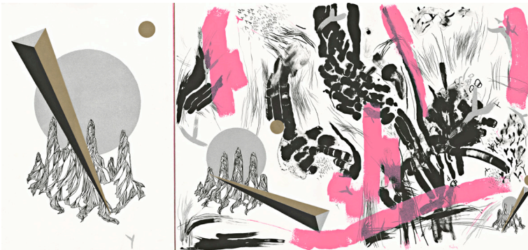
Yuliia Koval + Petros Sianos Lithographie, mehrfarbig Papier: BFK Rives, 270 gr. Format: 88,0 x 40,0 cm, gefaltet auf 30,0 x 40,0 cm