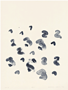
Oleskiy Koval Lithographie, einfarbig Papier: Maniani, 270 gr. Format: 30,0 x 40,0 cm