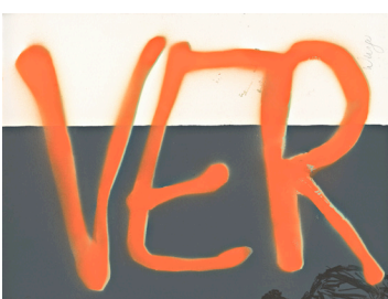
Veronika Wenger Lithographie, übersprüht Papier: BFK Rives, 300 gr. Format: 30,0 x 40,0 cm